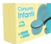
Conjunto Infantil 02 peças