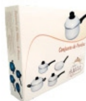
Conjunto de Panelas Mãe Ágata 04 peças