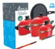
Conjunto de Panelas Ewel 04 peças