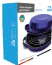
Churrasqueira para fogão 01 peça