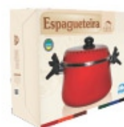
Espagueteira 01 peça